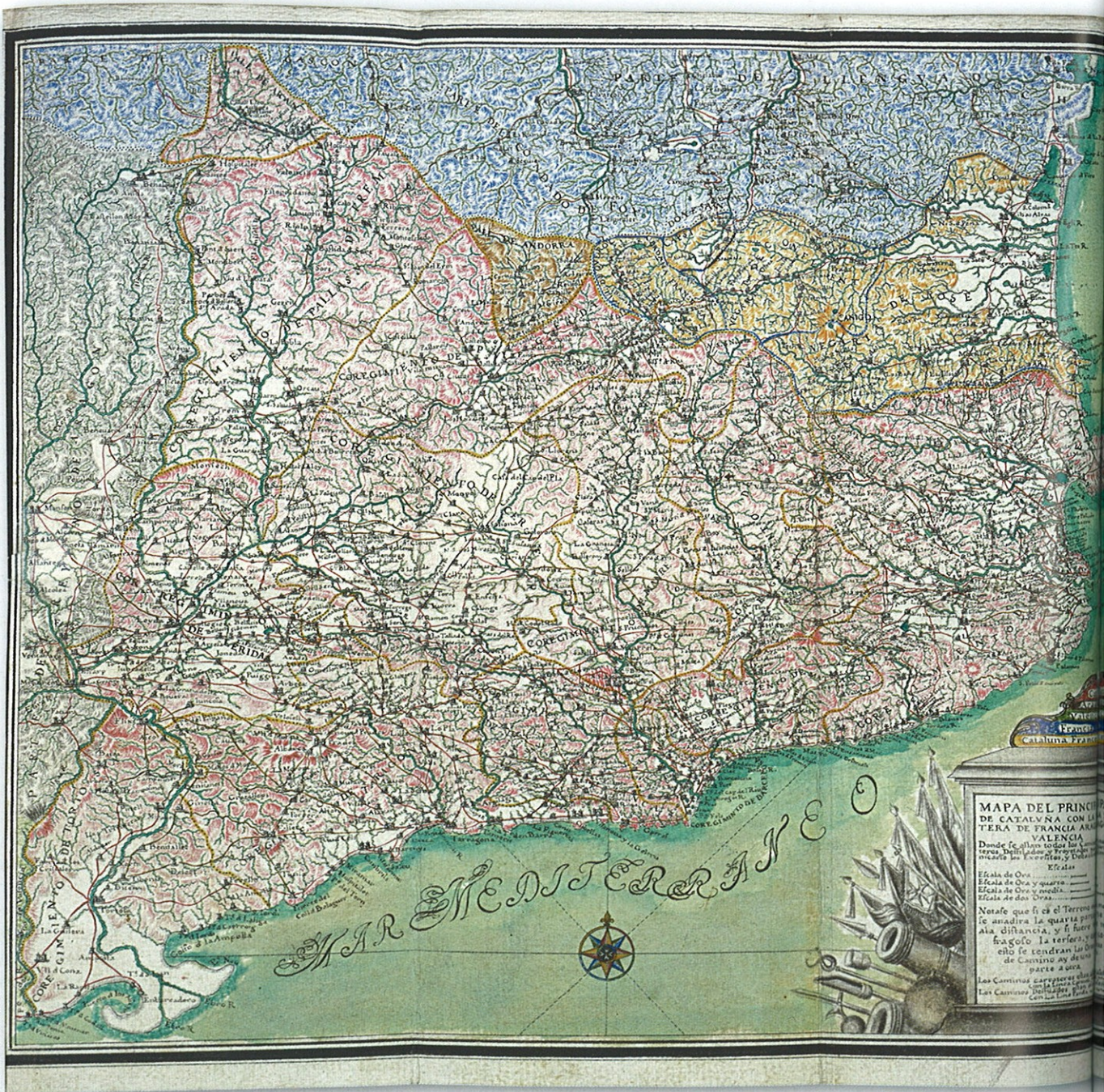
Mapa de Catalunya dins una guia de camins escrita pel comte de Darnius.

«EL FET QUE BONA PART DE LA PRODUCCIÓ D'OLEGUER TAVERNER HAGI QUEDAT MANUSCRITA L'HA ALLUNYAT DELS REPERTORIS DE CARTOGRAFIA MÉS CONSULTATS, SOVINT DEDICATS A LA PRODUCCIÓ IMPRESA»